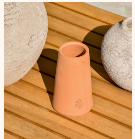
Objets de décoration